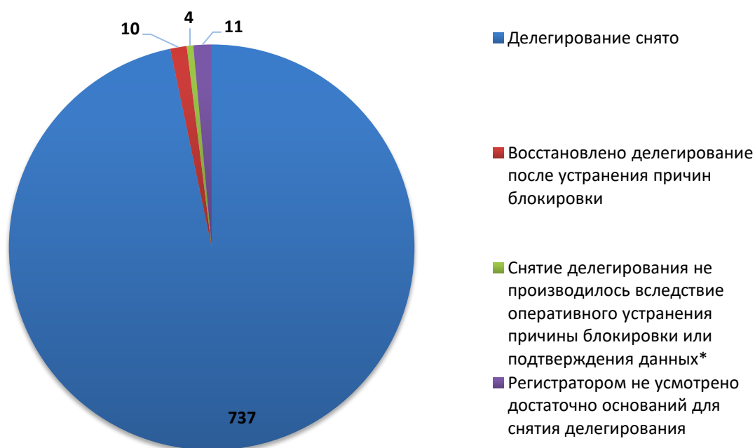
Рис.3 Итоги обработки обращений о снятии делегирования (май 2019)

За отчетный период по обращениям компетентных организаций были сняты с делегирования 747 доменных имен. Для 4 доменных имен снятие делегирования не потребовалось вследствие оперативного устранения причин блокировки администратором домена (или ресурс был заблокирован хостинг-провайдером) или своевременного подтверждения администратором домена идентификационных данных. В 11 случаях регистратором не усмотрено достаточно оснований для снятия делегирования или инициирования проверки администратора.